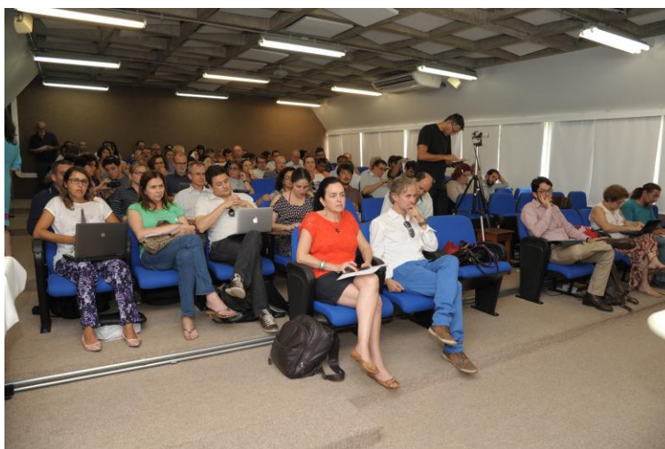
Participantes durante o Fórum.